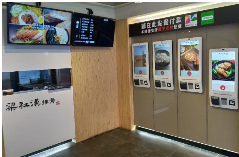
Kiosk自助點餐、POS、KDS接單、數位廣告看版