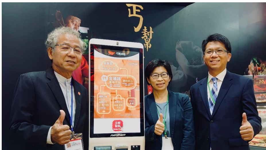
全通路平台協助用數據搶市佔