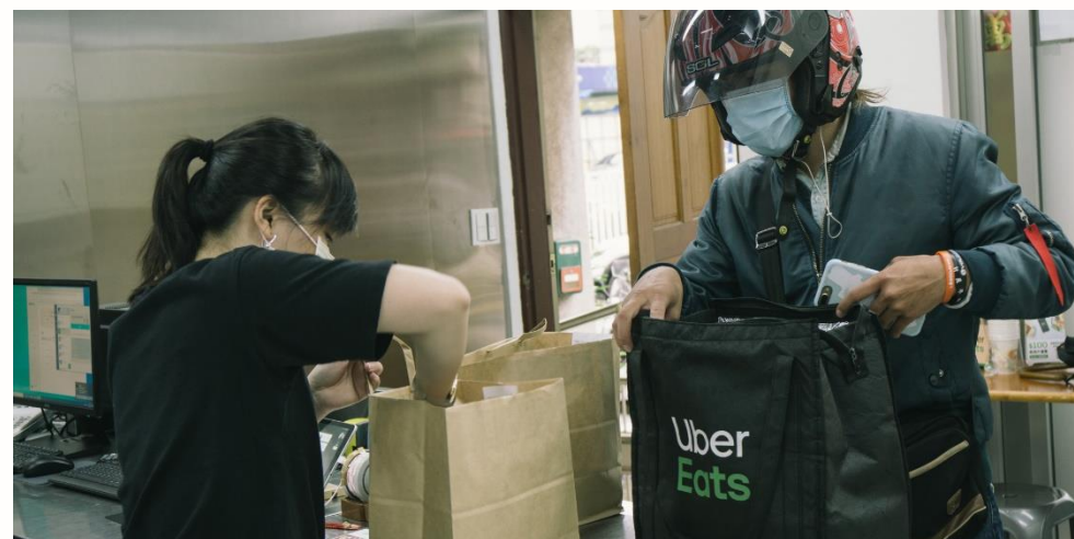
防疫新商機“零接觸”幽靈廚房+外送當道