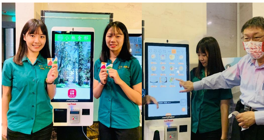
無現金智慧校園4.0 線上訂餐+支付普及化