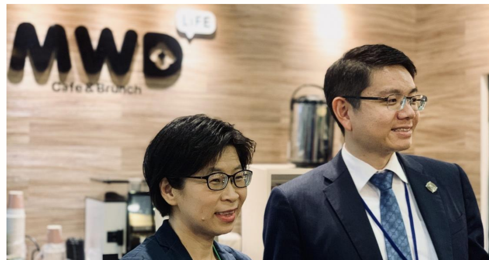
品牌APP改版、MWD Pay優化會員消費旅程